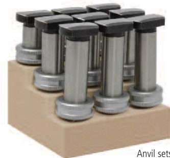
Anvil sets 300-400mm

Individual instruments: Supplied with digital display unit, measuring head with exchangeable anvils and setting ring with UKAS certificate